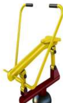
MÁQUINA TIPO REMO