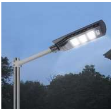
EJEMPLO DE LÁMPARA A UTILIZAR