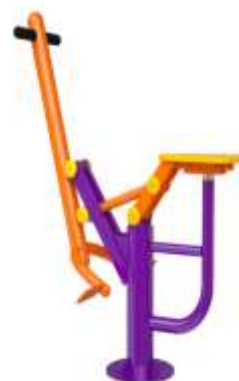
MÁQUINA TIPO CABALLO