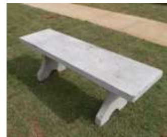
EJEMPLO DE BANCA DE CONCRETO A RESTAURAR