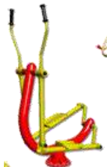
MÁQUINA TIPO ELÍPTICA