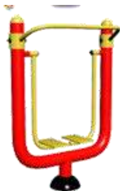
MÁQUINA TIPO ANDADOR