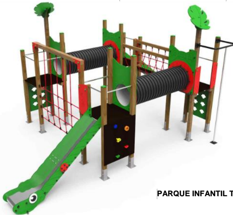
PARQUE INFANTIL TIPO AMAZONIA